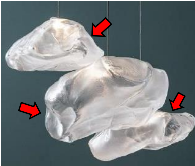
異なる形状・質量