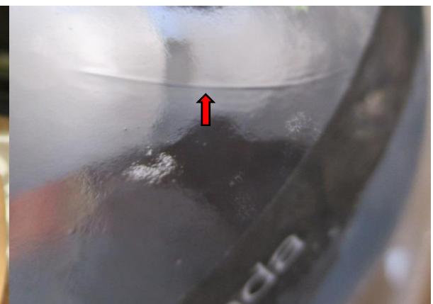
ガラス表面のスジ